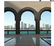
Musée des Arts islamiques, Doha, Qatar