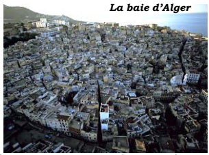
La baie d'Alger

4 ème langue au niveau mondial, langue officielle de 22 pays qui s'étendent de l'Océan atlantique au Golfe arabo-persique sans discontinuité géographique, la langue arabe est l'une des plus anciennes langues vivantes.