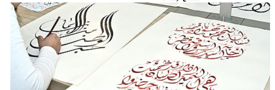
Cours de calligraphie, Doha, Qatar

Langue maternelle ou découverte, l'arabe est une option intéressante et un atout pour le baccalauréat. Son apprentissage peut être ensuite poursuivi dans l'enseignement supérieur et être un plus pour se présenter à certains concours.