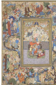
Le lecteur, Ouzbékistan, Boukhara 1600 - 1630

L'arabe a la réputation d'être une langue difficile. C'est une idée reçue sans fondement. L'arabe s'écrit comme il se prononce, la dictée, par exemple, ne présente pas de difficultés majeures. Bien entendu, chaque langue a ses particularités. L'arabe tire son originalité de la richesse de son vocabulaire et de la poésie de la syntaxe.