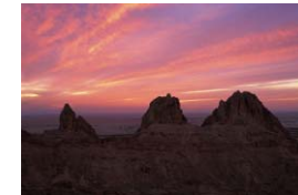
Jebel Hafeet, 1240 mètres, E.A.U.

Si elle peut aussi être parfois proposée en LV2, la langue arabe est enseignée au sein du lycée en LV3. Elle constitue donc une option au baccalauréat. Une bonne assiduité en cours et des textes bien préparés permettent lors de l'épreuve orale (pas d'épreuve écrite) d'acquiescer des points qui peuvent s'avérer précieux pour décrocher une mention ou éviter le rattrapage.