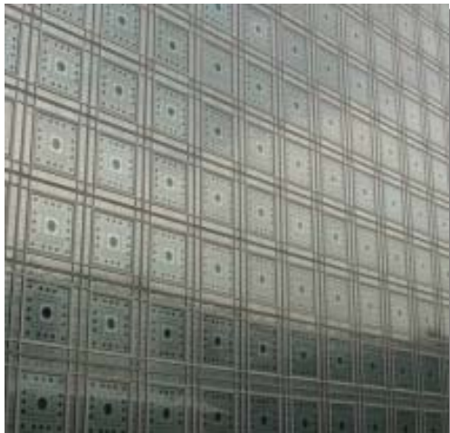
Façade de l'Institut du Monde Arabe, Paris