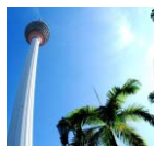
La tour KL, 421 m, Kuala Lumpur