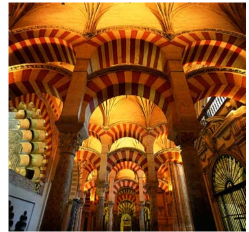
Perspective sur les Arcs de Abdelrahman II, Grande Mosquée de Cordoue